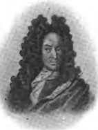
Georg Ernst Stahl.

Balsamum vitae Hoffmanni und anderer nach ihm benannter Arzneimittel). Hoffmann hat auch die Mineralwässer eingeführt. — Der grosse Gegner Hoffmanns ist Georg Ernst Stahl (1660—1734), Professor in Halle und Leibarzt in Berlin, der Begründer des «Animismus», welcher die Anima als Erhalter des Organismus und Regulator aller Lebensvorgänge annimmt. Diese Idee wird in seiner Schrift «Theoria medica vera» entwickelt, welche im übrigen bezüglich der Pathogenese der Krankheiten humorale Anschauungen zum Ausdruck bringt und die Plethora als die Hauptursache der meisten Erkrankungen anspricht, gegen welche die Anima die Blutungen als therapeutisches Mittel in Anwendung bringt. Diese Blutstockung sitzt im Kindesalter meist im Kopf, im Jünglingsalter in der Brust und beim Manne in den Bauchorganen. Die wohl-